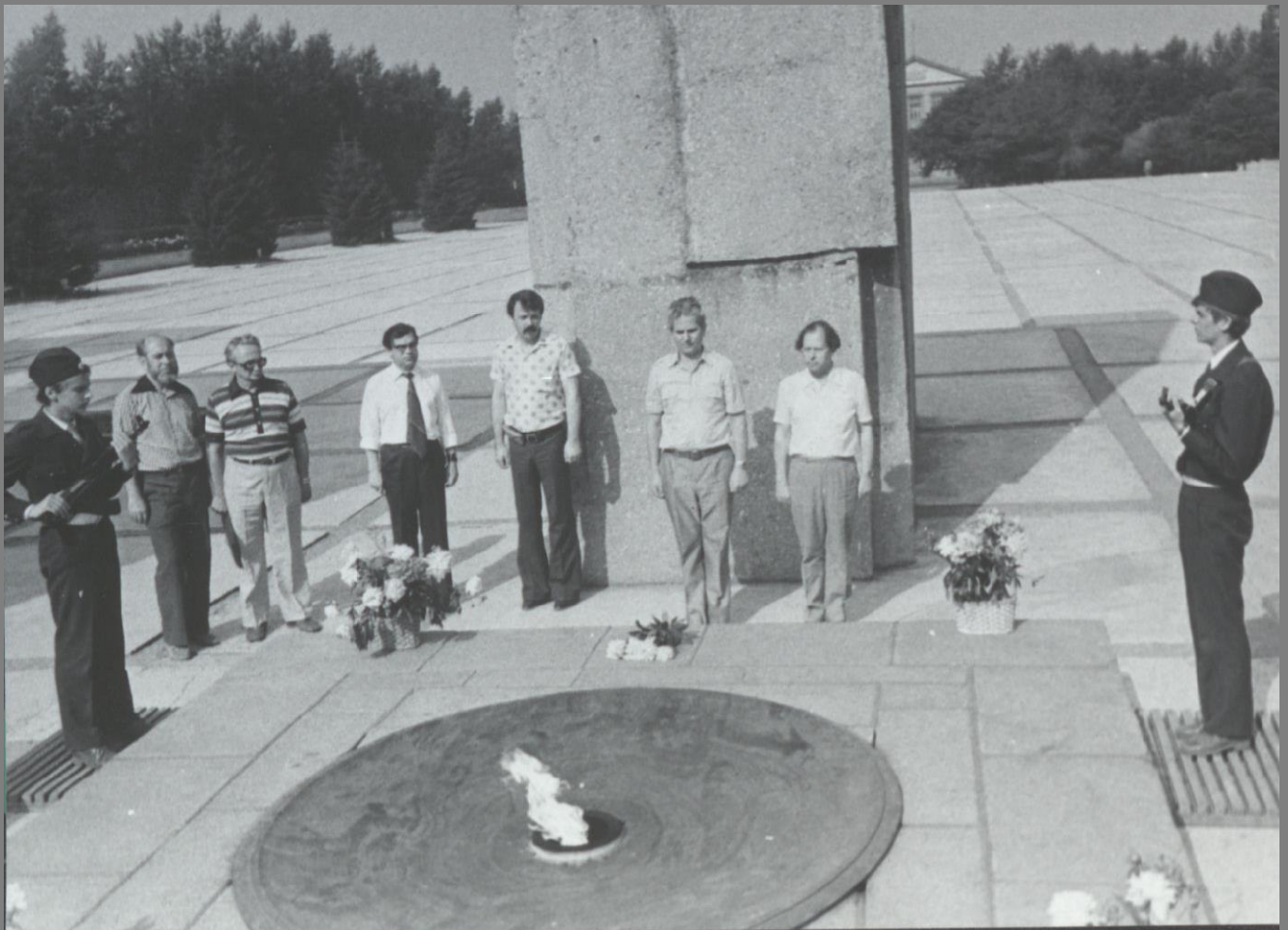
Визиты правительственных делегаций к Монументу Славы. Почетный караул у Вечного огня.