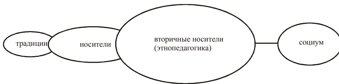
Рис. 1. Схема передачи традиций через посредство этнопедагогика

Механизм передачи традиций в школе «Васюганье» может быть выражен и через предметную деятельность (рис. 2).