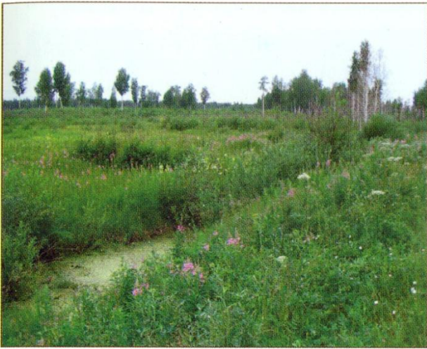
Заболоченные подтаёжные леса Васюганья.