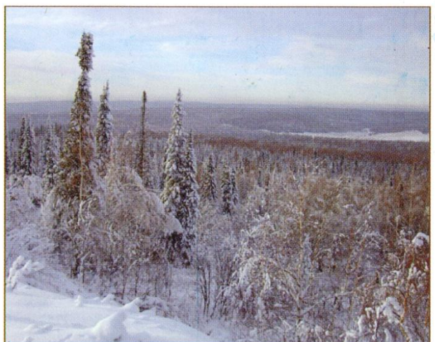
Вид с Пихтового гребня.