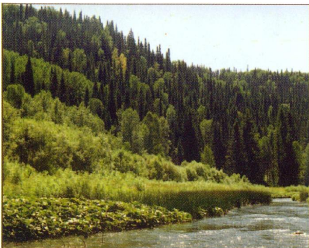
Пихтовники в верховье Берди.