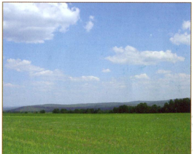
На горизонте основная гряда Салаирского кряжа.