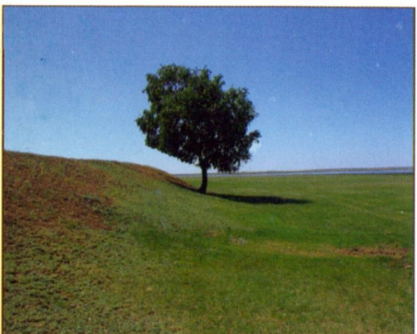
Грива на побережье озера Малые Чаны.