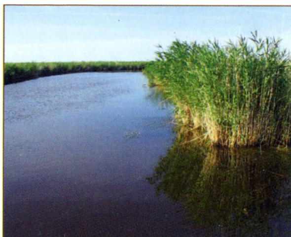
Тростниковые заросли на озере Чаны.