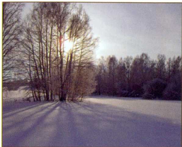
Зима в Барабе.