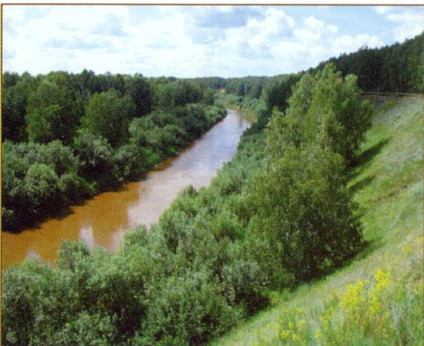
Кыштовский район. Река Тара.