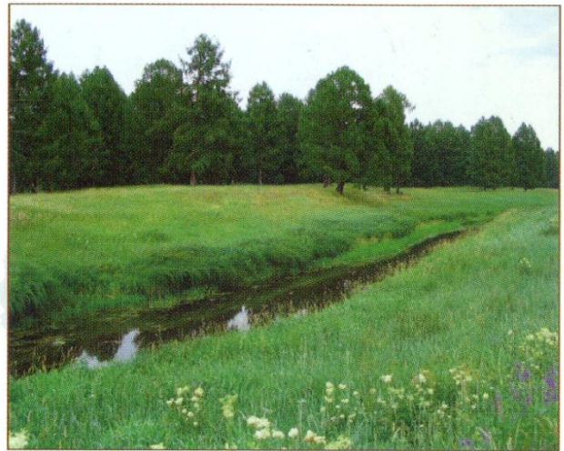
Кыштовский район. На правом берегу реки Уй начинается тайга.