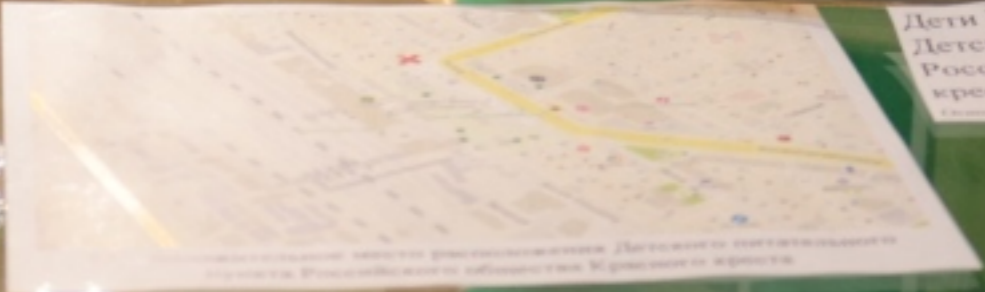
План маршрута доставки продовольствия Детского питательного пункта Российского общества Красного креста