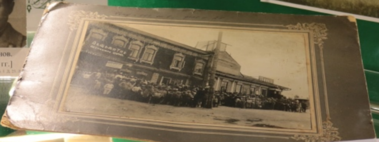
Дети Поволжья у здания Детского питательного пункта Российского общества Красного креста. 1921 г.