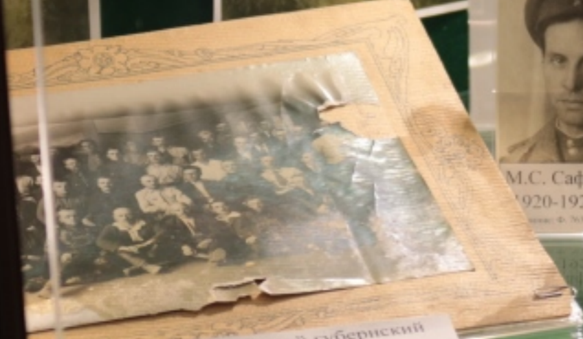
Новонокозлевский губернский защиты.