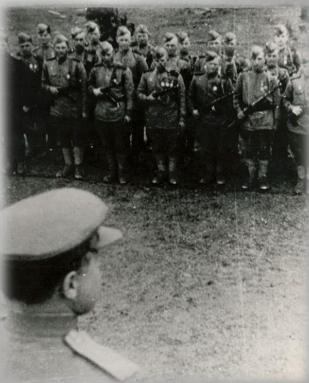
Бойцы 22-й Гвардейской стрелковой дивизии сибиряков-гвардейцев 19-го стрелкового корпуса перед ответственным штурмом