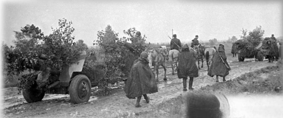
Новые резервы Красной Армии идут на фронт

Большой вклад внесли производственные коллективы. Колхозы и совхозы, предприятия и учреждения передали на укомплектование только 150-й стрелковой дивизии 2 108 лошадей, 750 повозок, 92 автомашины. Рабочие и служащие заводов Новосибирска и области во вне рабочее время сверх плана изготовили необходимое количество средств связи и другие предметы боевого и материально-бытового оснащения.