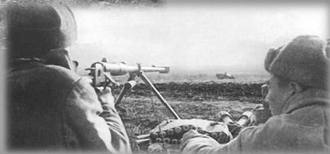
ПТРД-41 (противотанковое ружье Дегтярева образца 1941г.)