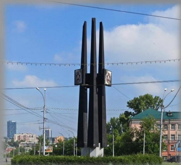
Список сибирских дивизий РККА на Монументе Славы