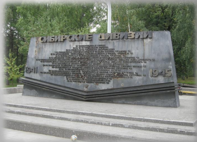
Стела «Штыки» на площади Сибиряков-гвардейцев

Фрагмент решения Новосибирского Горисполкома от 28 апреля 1965 г. №304