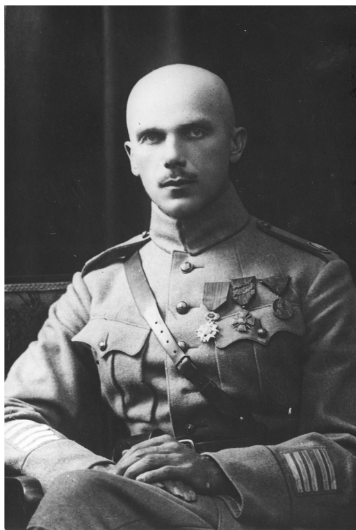
Рис. 2. Полковник Казимир Румша ( https://ru.wikipedia.org/wiki/Румша,_Казимир )

Достаточно подробно Румша описывает и взаимоотношения между польским и чешским военным командованиями, но их суть давно известна российским исследователям. В целом, рапорт не лишен влияния личного негативного отношения полковника Румши к советской власти, РККА и партизанам, отличается эмоциональной окраской. Создается впечатление, что полковник тяготился своим положением и нейтралитетом, объявленным польским командованием, был рад любой возможности проведения боевых действий с советскими и просоветскими частями. Вполне возможно, что остальные командиры дивизии, особенно из противостоящей Румше группировки, не были столь непримиримы и не так рвались в бой – их больше занимал вопрос скорейшего отбытия в Польшу (Витольдова-Лютык, 2004. С. 520). Полковнику было необходимо не только скрыть свое участие в подавлении мятежа Барабинского полка, но и в других возможных нарушениях нейтралитета, а также оправдаться за нарушение приказа выше-