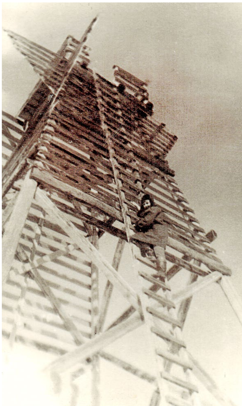
Навигационный знак на острове Вилькицкого, построенный в 1936 году.