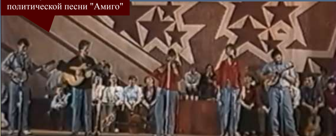
Выступление ансамбля политической песни "Амиго"