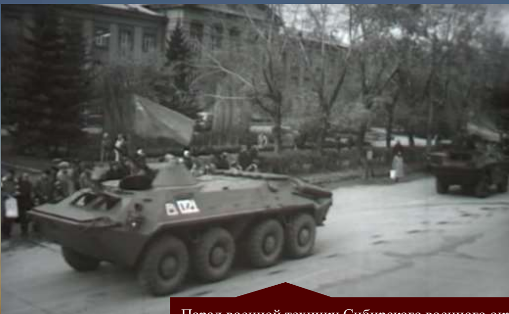
Парад военной техники Сибирского военного округа и ДОСААФ на ул. Станиславского