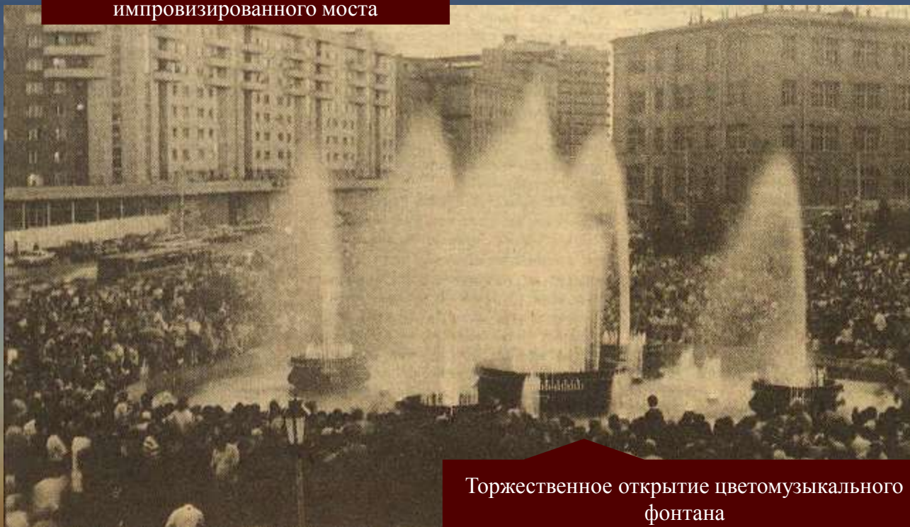
Торжественное открытие цветомузыкального фонтана

К юбилейной дате Новосибирск был украшен великолепным цветомузыкальным фонтаном возле здания театра «Глобус».