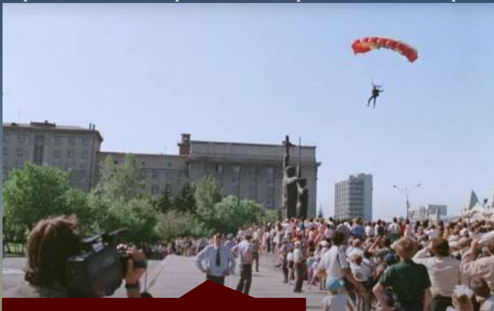
Момент приземления парашютиста

Созданные символы праздника – вымышленные персонажи Городовичок (с 1989 г.) и Обинушка (с 1991 г.), тоже были задействованы в сценарии торжественного открытия Дня города в 1993 г. Торжественное открытие Дня города на площади им. Ленина было красочным: вышагивали кони, ехали дети на велосипедах и кортеж с Городовичком. Кульминацией праздника были парашютисты, приземляющиеся прямо на площадь им. Ленина.