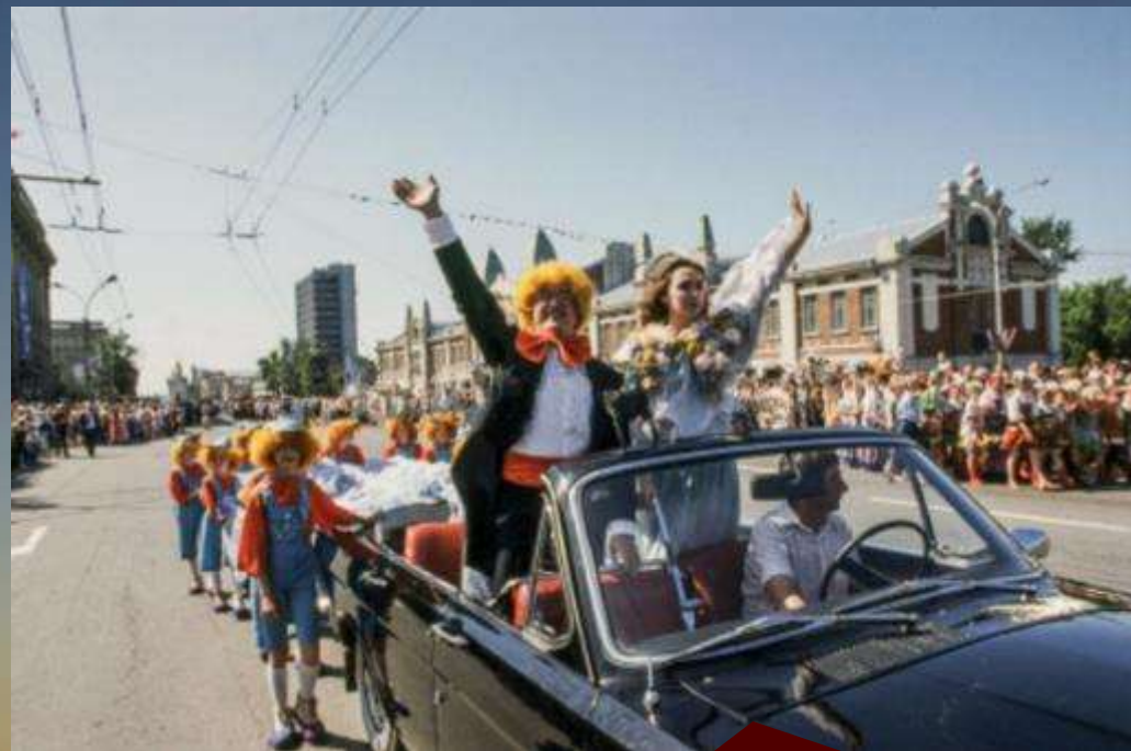
Городовичок и Обинушка проезжают на «Волге». Шлейф Обинушки несут 14 Городовичков (танцевальный коллектив ДК им. Горького)