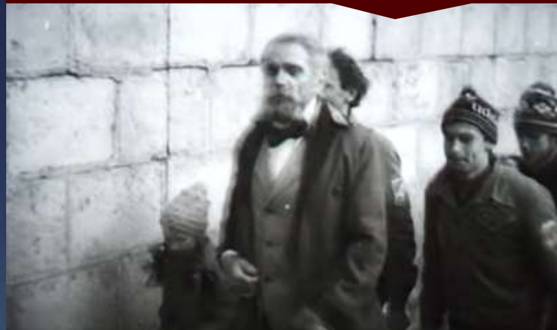
Театрализованное шествие бойцов Первой конной на ул. Станиславского