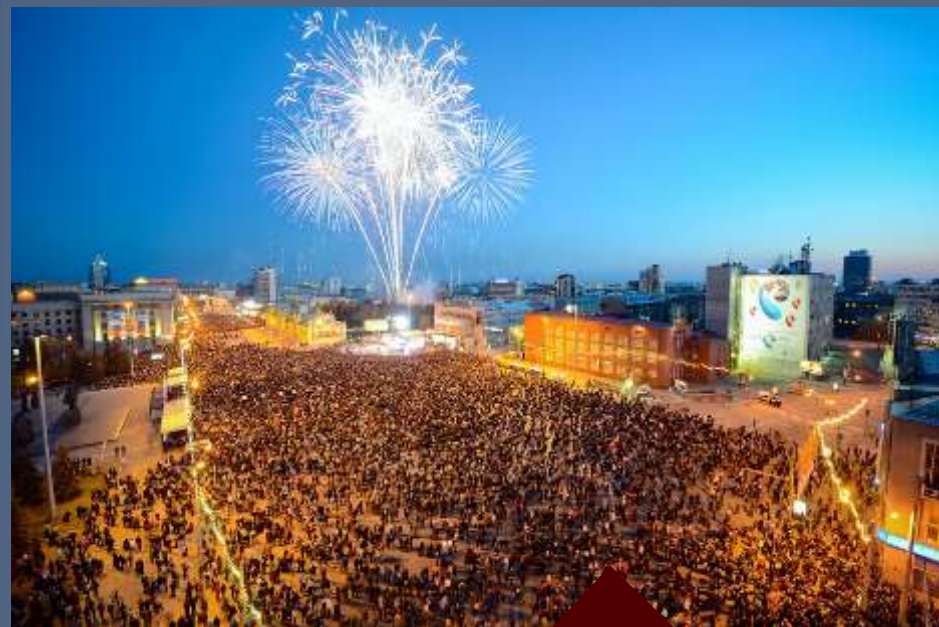
Праздничный фейерверк к 122-летию Новосибирска. 28 июня 2015 г.

Одним из традиционных мероприятий Дня города является праздничный фейерверк. Салют устраивается в разных местах, разбросанных по всему городу, и длится в общей сложности с 22:00 до 23:30. Например, в 2014 году было запланировано семь наблюдательных площадок: