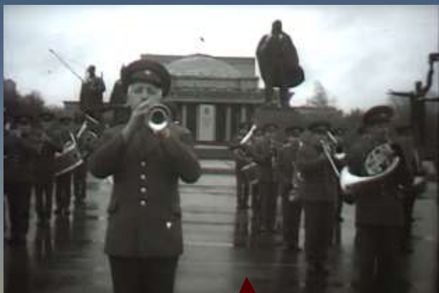
Сводный духовой оркестр

В 12:00 во всех памятных местах города прошел «Час памяти».