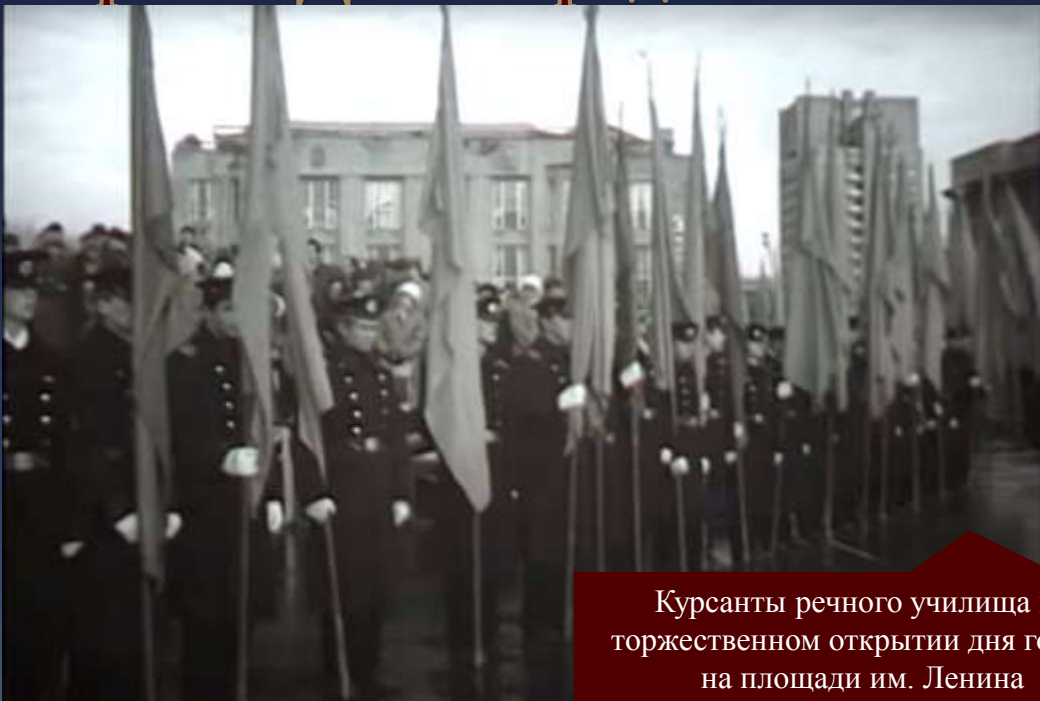
Курсанты речного училища на торжественном открытии дня города на площади им. Ленина