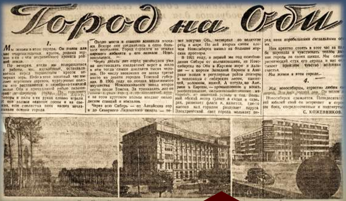
Фрагмент статьи «Город на Оби» из газеты «Советская Сибирь» от 3 ноября 1943 г.

Ко дню рождения города в нестроенном оперном театре состоялось торжественное собрание, в фойе была открыта историческая фотовыставка. К юбилейной дате Новосибирска на страницах газеты «Советская Сибирь» от 3 ноября 1943 г. была опубликована статья «Город на Оби».