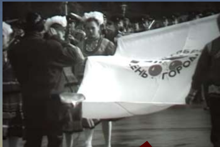
Торжественный вынос флага праздника