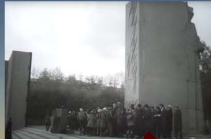
«Час памяти» на монументе Славы воинов-сибиряков