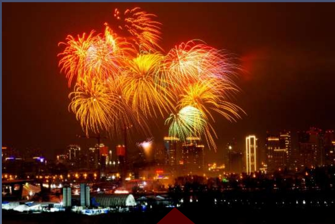
Праздничный фейерверк к 129-летию Новосибирска. 26 июня 2022 г.