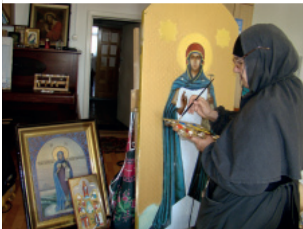
Реставрация иконы Матери Божией