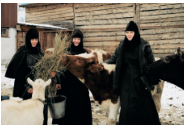
На подсобном хозяйстве