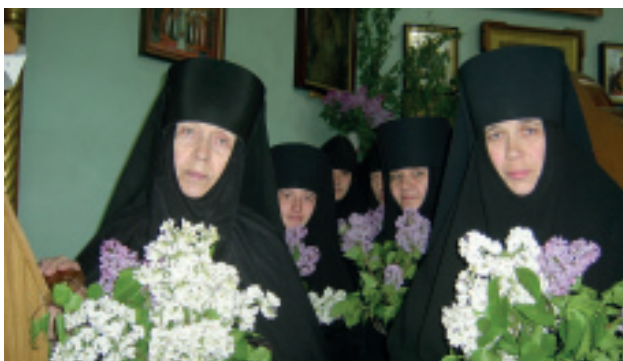
Праздник Святой Троицы