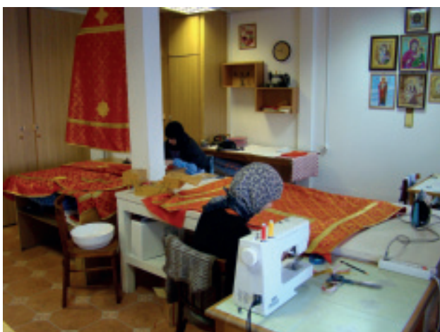
В монастырской ризнице