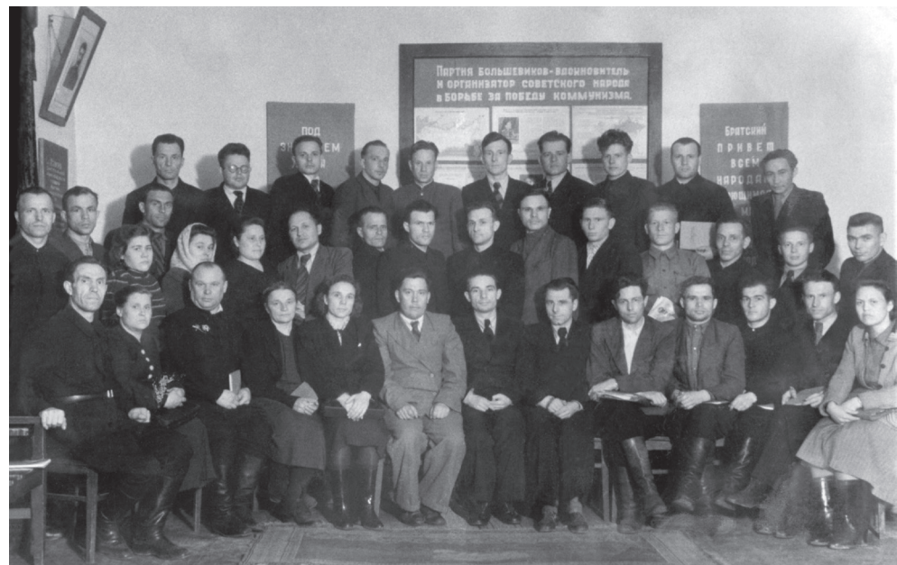
После лекции на семинаре редакторов, 1952–1953 г.