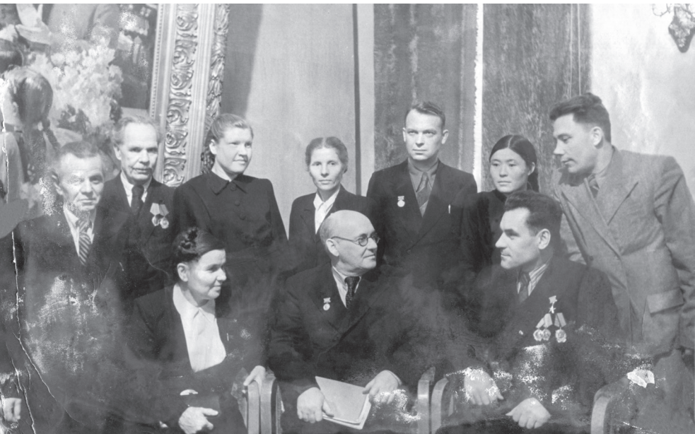
3 Всесоюзная конференция сторонников мира, 27-29 ноября 1951 г., Москва