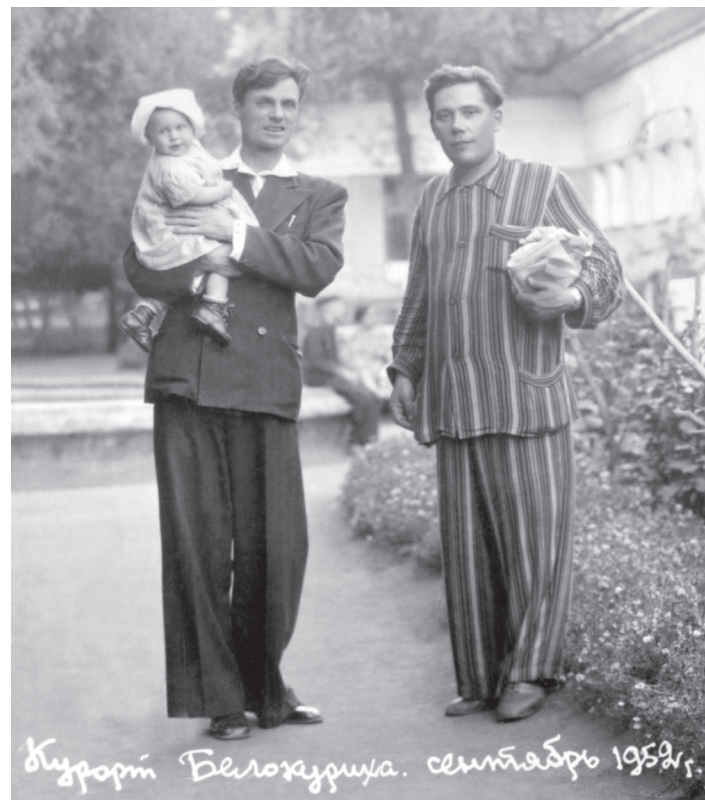
Белокуриха, сентябрь 1952