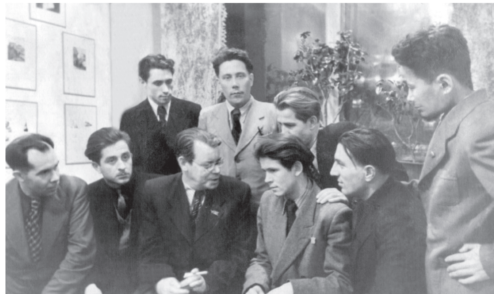
С М. Исаковским, 24 марта, 1951, Москва