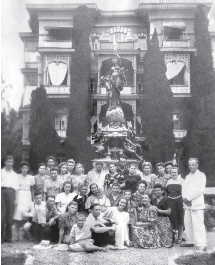
Крым, после литературного вечера