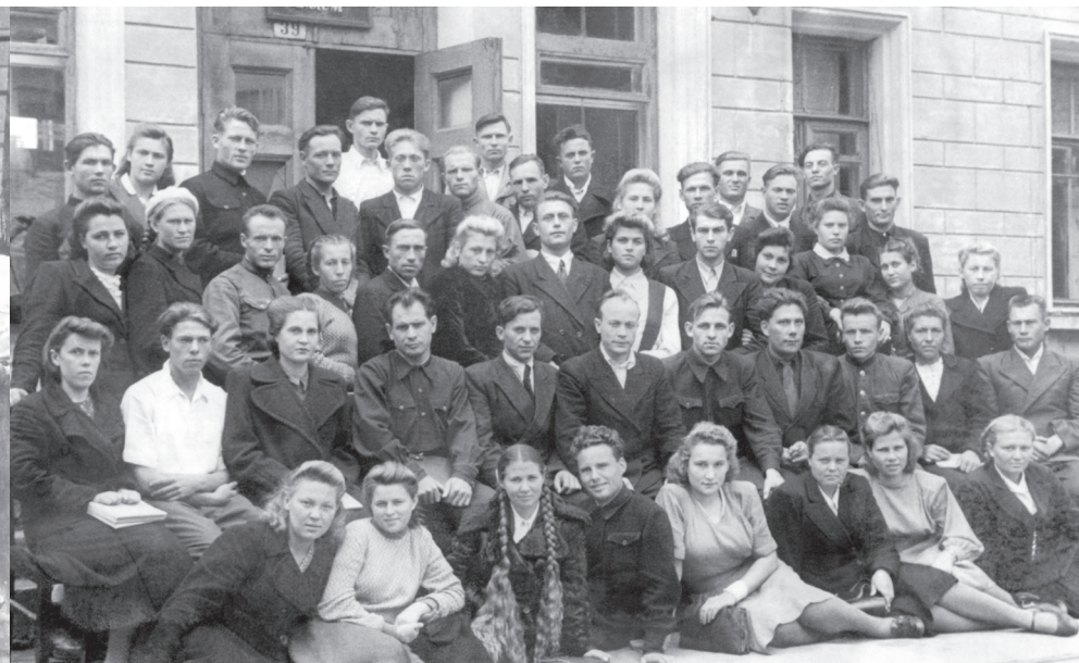
Семинар в крайкоме ВЛКСМ, Барнаул