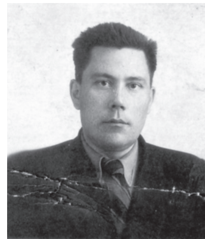
Июнь 1954, Барнаул