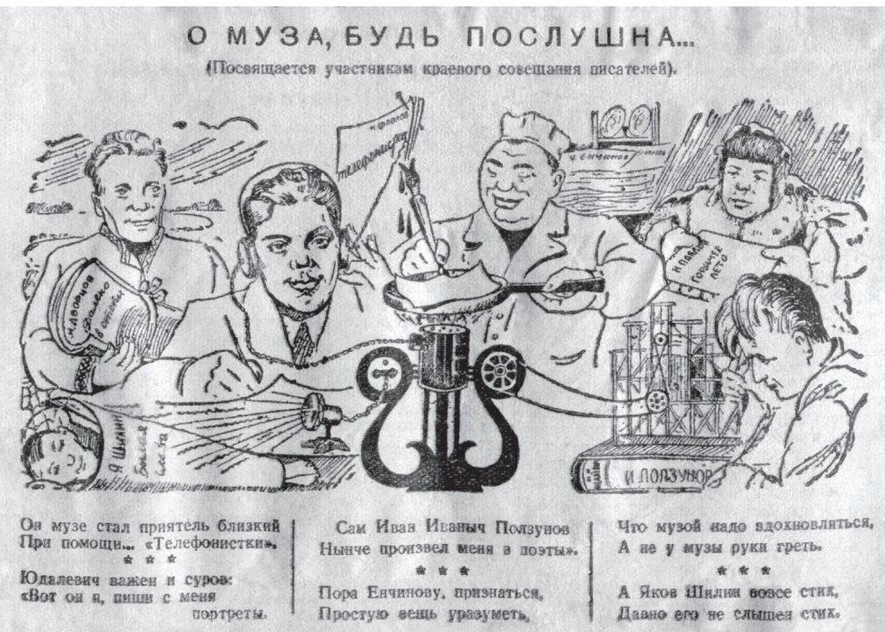
Шарж из газеты «Сталинская смена»