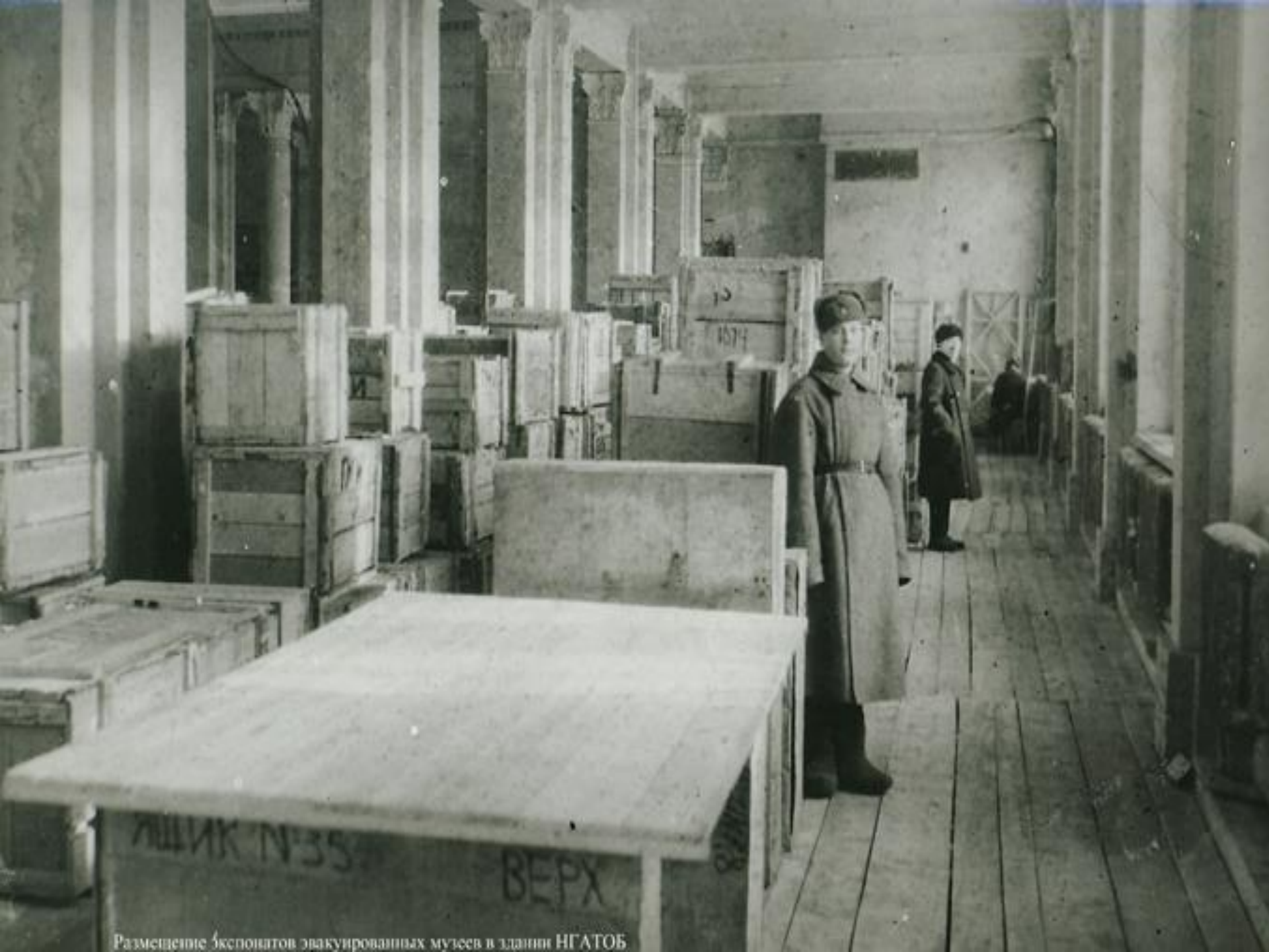
Размещение экспонатов эвакуированных музеев в здании НГТОБ