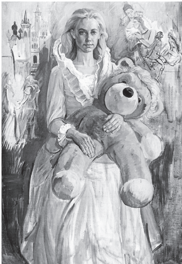
Золушка. Портрет дочери