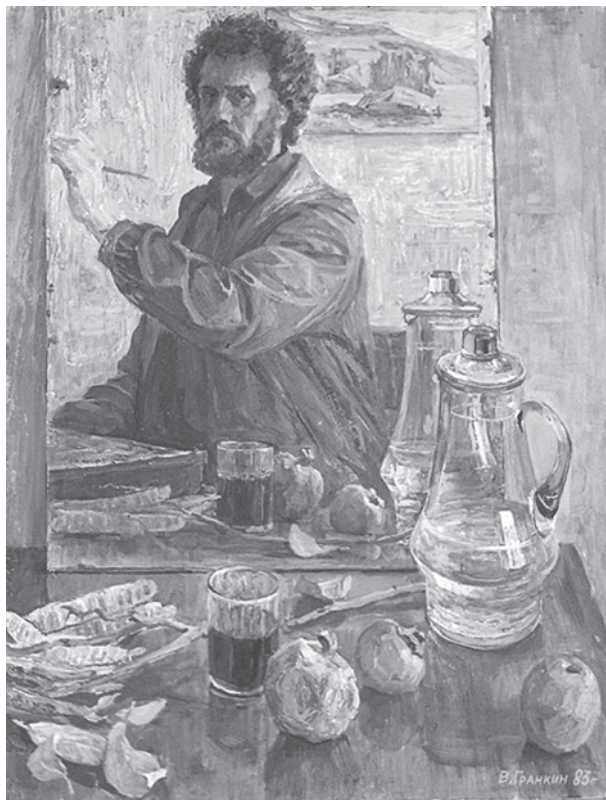
Натюрморт с зеркалом. Автопортрет