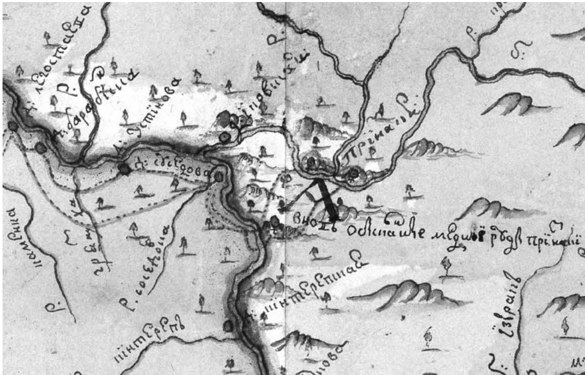
Рисунок 3. Фрагмент карты Пимена Старцова 1752 г. Места с признаками медных руд (А)