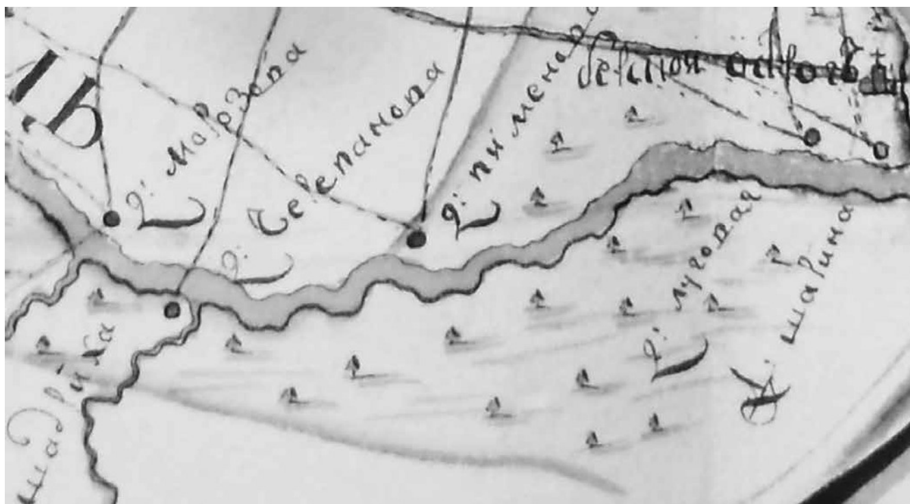
Рисунок 5. Деревня Пименова на «Карте деревень в ведомстве Бердской земской избы», 1771 г.

История сохранила и некоторые подробности деятельности заводладельца Мельникова, ставившего своё производство на противоположном от Пименовой берегу Берди.