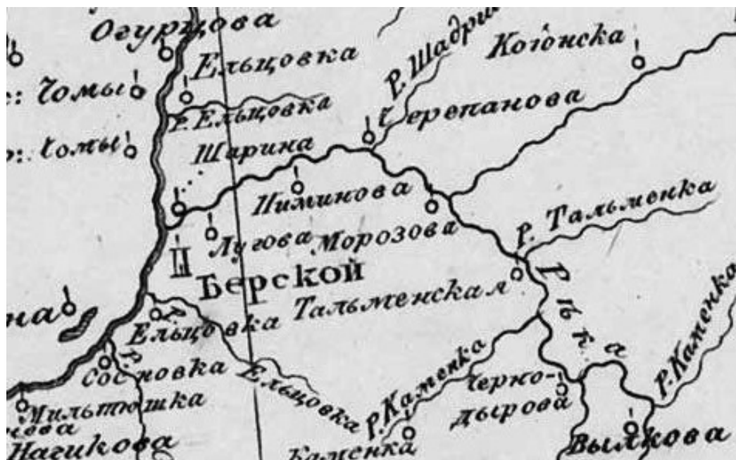
Рисунок 6. Деревня Пиминова на карте «Колывано-Воскресенской горной округи», 1816 г.

Мельников, как откупщик, имел право носить в казну фиксированную плату вместо сбора питейных налогов и пытался монополизировать винокурение как в ведомстве Бердского острога, так и в Малышевской слободе. Он скупал зерно для собственного винного производства, а за разрешение крестьянам варить пиво только для личных нужд требовал с каждого двора по 3 пуда зерна [3, с.78].