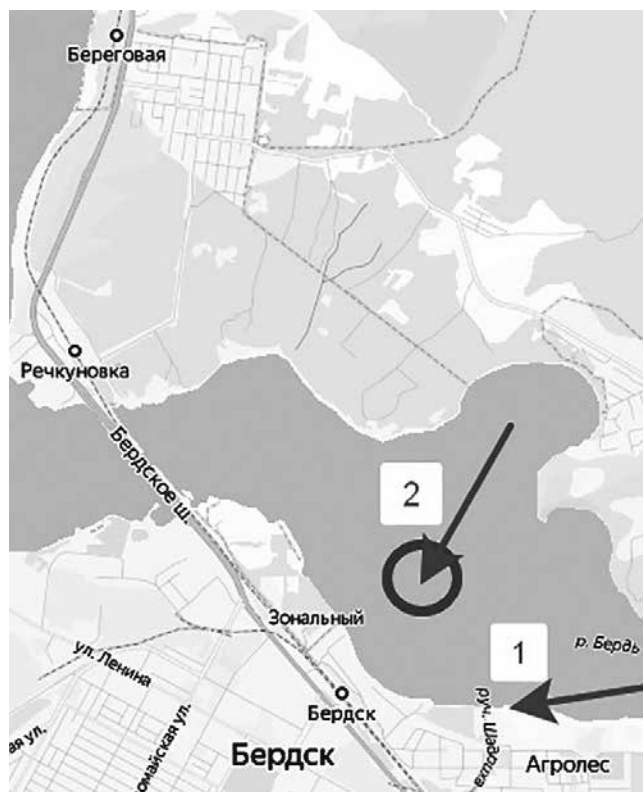
Рисунок 7. Вероятное место расположения деревни Пименовой, винокуренного завода Мельникова и планировавшегося к постройке медеплавильного завода (2) ниже устья ручья Шадриха (1)

Она показана на «Карте деревень в ведомстве Бердской земской избы» 1771 года [4]