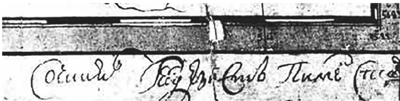
Рисунок 1. Автограф Пимена Старцова на «Ландкарте», 1745 г.